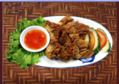
T10 - Raviolis frits de poulet et crevettes