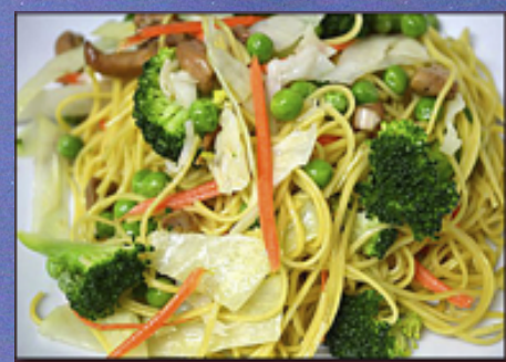
A52 - Nouilles sautées à la chinoise (Nouilles fines sautées aux légumes)