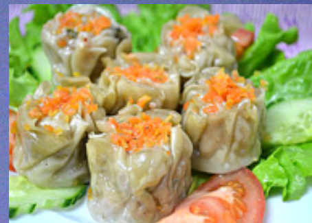
T17 - Raviolis poulet et crevettes à la vapeur