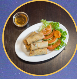
Nems au poulet