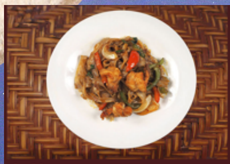
A37 - Phad Kee Mao (Nouilles larges sautées aux légumes, sauce basilic)