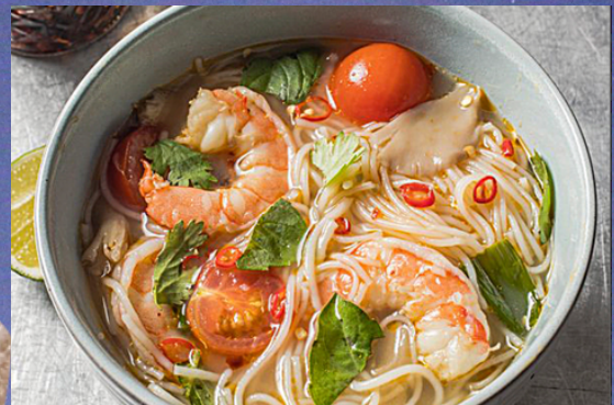
A40 - Kuay Tiaow Tom Yum 11 (Soupe de pâtes de riz à la citronnelle et au lait de coco)