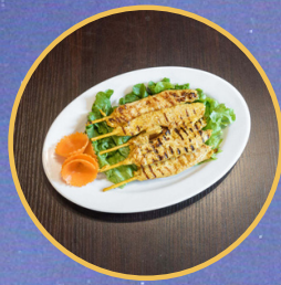
Brochette au poulet satay