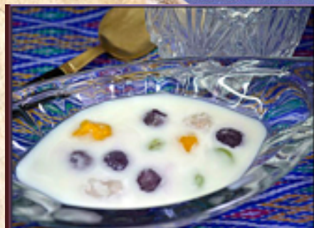
D7 - Bua Loy 6.00 (Boulettes de pandan, taro, patate douce et citrouille dans lait de coco)