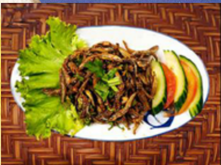
T11 - Salade de petits poissons frits