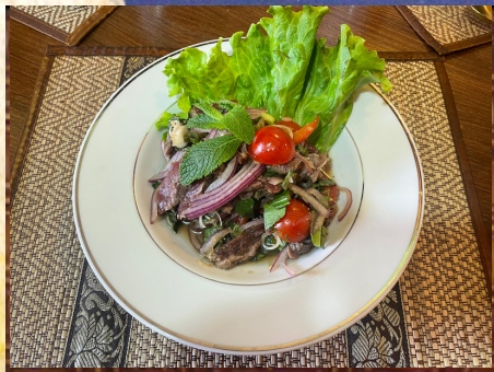
T15 - Salade thai de lamelles viande épicées