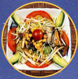
Salade au poulet ou crevette