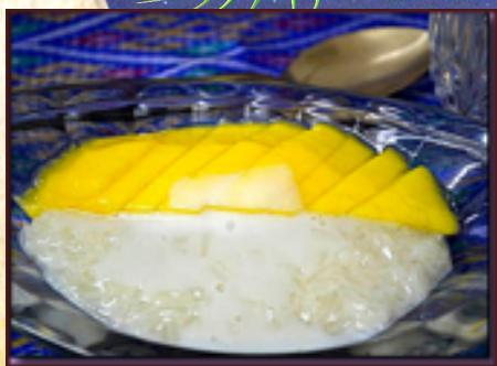
D1 - Khao Niaow Mamuang (Riz gluant au lait de coco)