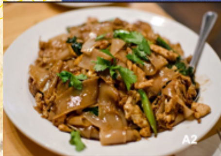
A1 - Phad Seu (Nouilles larges sautées aux légumes)