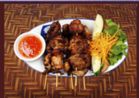
T4 - Brochettes au poulet