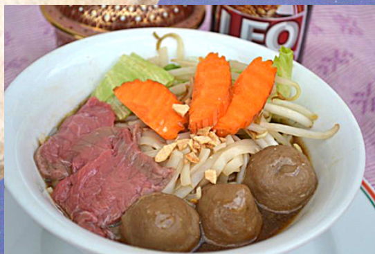
A41 - Kuay Tiaow Nam Tok 11 (Soupe de pâtes de riz, boulette et tranche de boeuf)