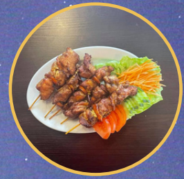
Brochette au poulet