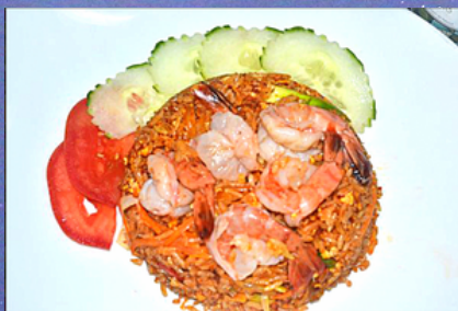
A45 - Phad Keemao (riz sauté basilic et légumes (oignons, carottes, poivrons, coriandres et œufs))