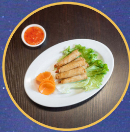
Beignet de crevettes