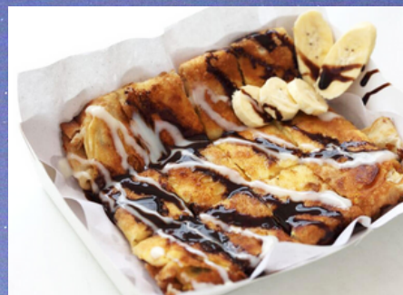
D11 - Thai pancake 6.00 (Pancake thaï fourré à la banane, coulis de chocolat ou caramel et lait concentré)