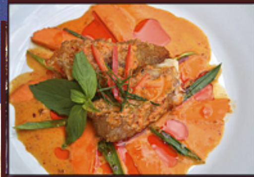
A43 - Chou chi kaeng deng (Crème au curry rouge et lait de coco, viande au choix)