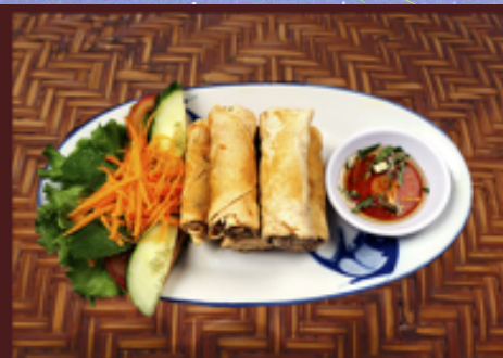
T2 - Nems au poulet