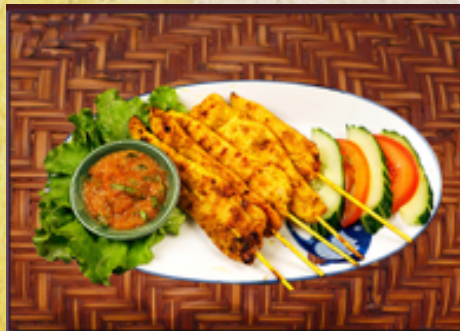
T5 - Brochette de poulet au satay