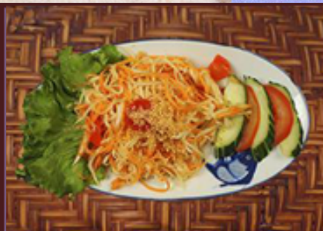
T6 - Som tam thaï 7.5 (salade de papaye, carottes et tomates cerises).