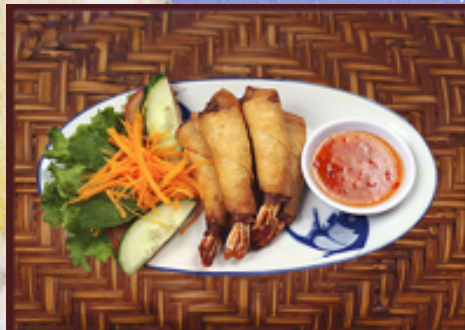
T1 - Beignets de crevettes