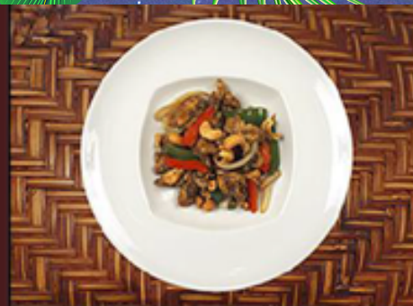
T16 - Sauté au noix de cajou