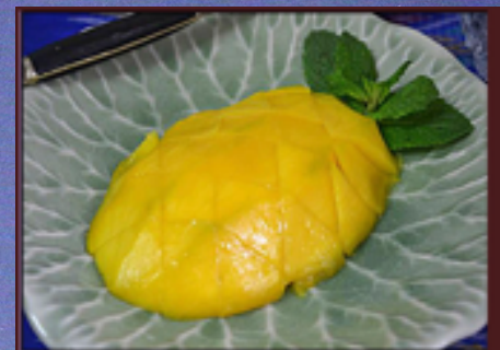
D9 - Mangue fraiche 5.00