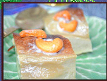
D3 - Flan thaï avec du lait de coco et caramel 4.00