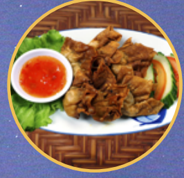
Ravioli frit au poulet et crevette