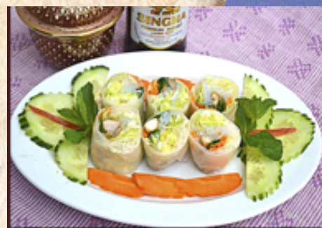
T14 - Roulés aux légumes frais