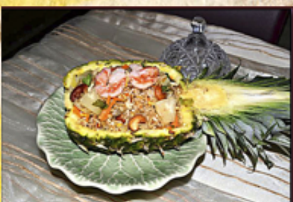
A38 - Khao Phad Saparod (riz sauté aux légumes, oignons, carottes, coriandres noix de cajou poivrons, ananas et oeuf) Pas servi dans l'ananas*