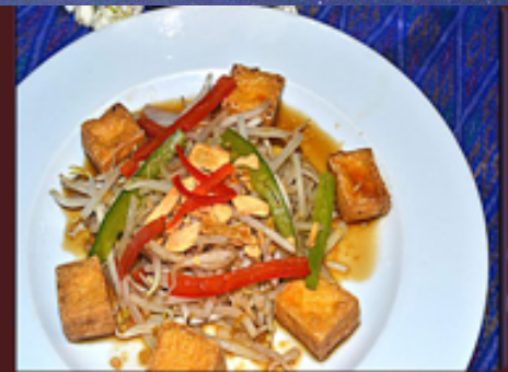
T26 - Sauté de soja et tofu