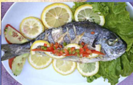
A21 - Poisson ou fruits de mer à la vapeur sauce seafood thaï (Dorade ou fruits de mer cuits à la vapeur)