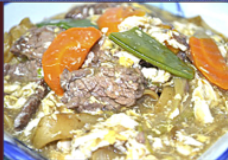
A4 - Lat Na (Nouilles larges sauté aux légumes recouvert de sa sauce épaisse)