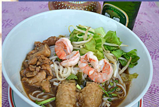
A39 - Kuay Tiaow Sukhothai 10.50 (Soupe de pâtes de riz façon Sukhothai)