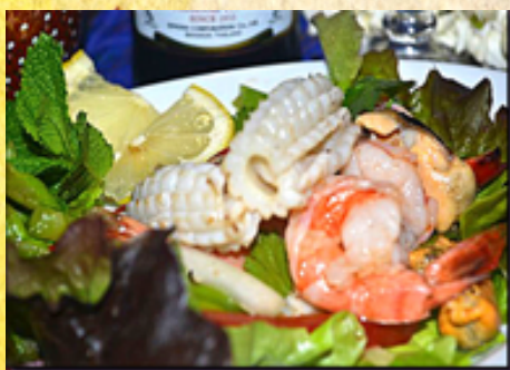
T20 - Salade de fruits de mer