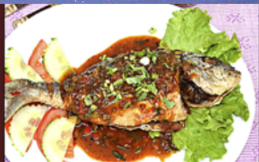
A23 - Dorade grillé à la sauce thaï