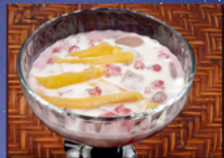
D5 - Tum Tim Krob 6.00 (Chataigne d'eau, fruit du jacquier, farine de tapioca et lait de coco)