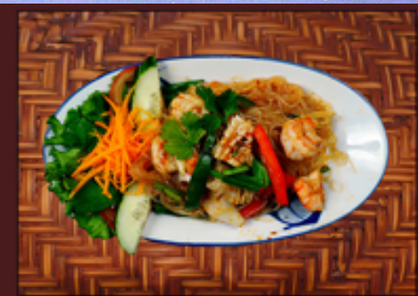
T7 - Vermicelles aux légumes 7.5