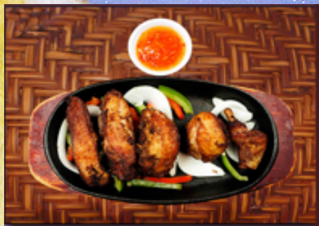
T8 - Poulet grillé à la plaque