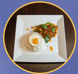
Phad Ka Pao