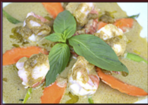
A44 - Chou chi Kiaow Wane (Crème au curry vert et lait de coco, viande au choix)