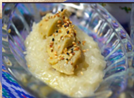
D10 - Khao Niaow Sangkhaya 6.50 (Riz gluant au flan thaï)