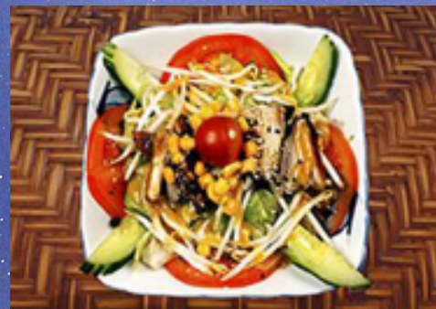
T12 - Salade de légumes sauce thaï