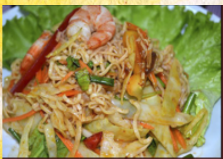
A51 - Phad Mama (Nouilles très fines sautées aux légumes pimentée)