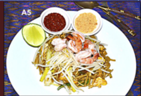
A5 - Phad Thai (Nouilles fines sautées aux légumes)