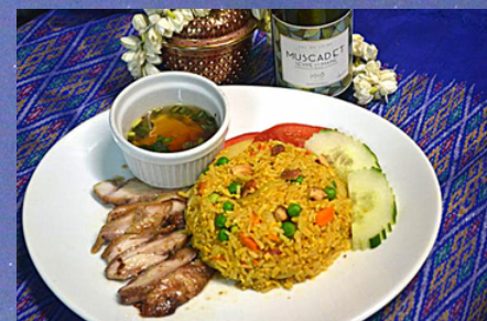
A46 - Khao Mok Gai (Riz sauté au curry et poulet frit)